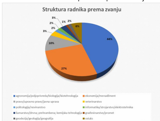
Grafikon 1: Struktura zaposlenih prema zvanju na dan 31.10.2023.

Organizacijska struktura Agencije za plaćanja u poljoprivredi, ribarstvu i ruralnom razvoju definirana je Pravilnikom o unutarnjem ustroju i sistematizaciji radnih mjesta iz 2020. godine te Pravilnikom o izmjenama i dopunama Pravilnika o unutarnjem ustroju i sistematizaciji radnih mjesta iz 2021. godine. Sve poslove iz svoje nadležnosti APPRRR obavlja putem središnjeg ureda kojeg čini ured ravnatelja, četrnaest (14) sektora s pripadajućim službama i šest (6) samostalnih službi te putem podružnica u jedinicama područne (regionalne) samouprave – njih dvadesetijedna (21) i četiri (4) ispostave. Na dan 31.10.2023. godine APPRRR zapošljava ukupno 798 djelatnika (središnji ured 425 djelatnika i podružnice 373 djelatnika).